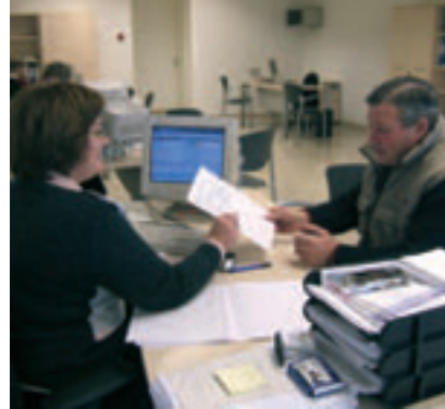
En Portada. Los ciudadanos de la provincia son atendidos en las oficina de sus respectivas comarcas